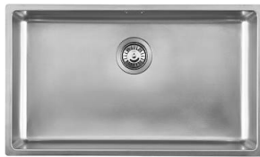
Fregadero KE - R15 Vintage 2157 080