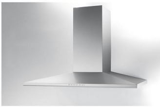
Campana extractora Amélie 2447 090